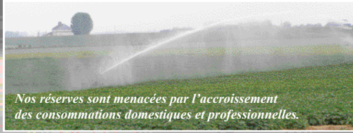
Nos réserves sont menacées par l'accroissement des consommations domestiques et professionnelles.

tes, la ressource de la nappe de la ée par la récupération de l'eau de facture d'eau, et faire œuvre utile.