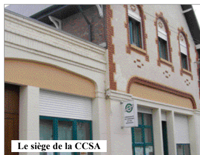
Le siège de la CCSA

L'objectif est de réaliser ensuite les aménagements, et de réduire à la fois les factures et notre contribution à l'effet de serre et aux dégradations climatiques.